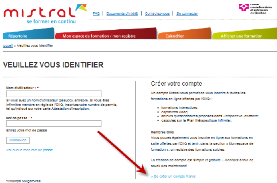
Figure 2 : Accéder au formulaire de création de compte